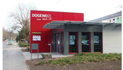
DOGEWO 21 Zentrale

Auftraggeber DOGEWO 21 - Dortmunder Gesellschaft für Wohnen mbH