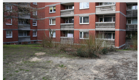
Bewertung der Pflegeleistungen